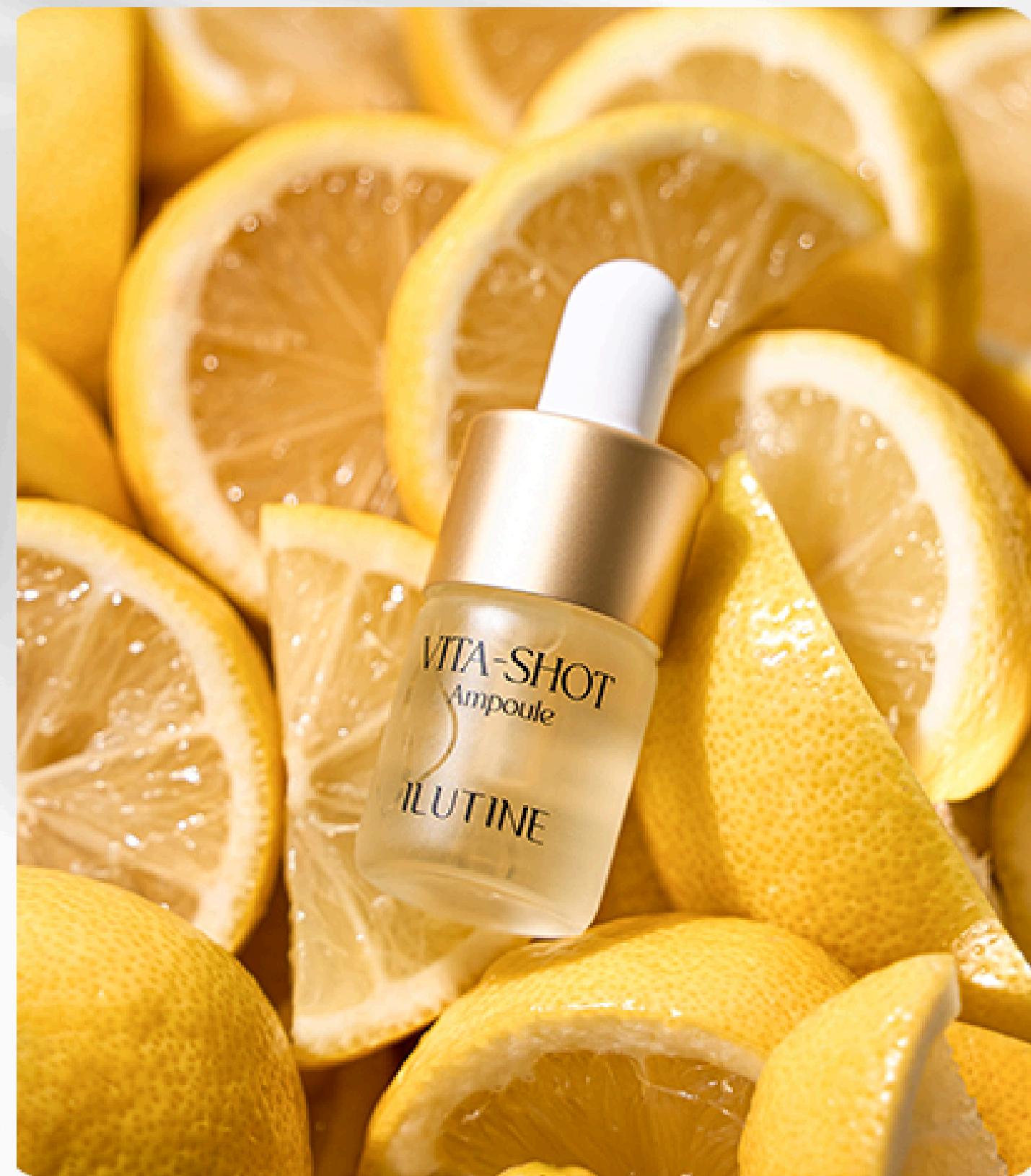
Vita Shot Ampoule